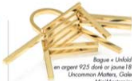
Bague « Unfold », en argent 925 doré or jaune 18 k, Uncommon Matters, Galerie MiniMasterpiece.

Avec le soutien de Van Cleef & Arpels, l'École des Arts Joailliers présente l'exposition « Lacloche, joailliers, 1892-1967 ». Pour la première fois, une exposition et un ouvrage rendent hommage à cette Maison de joaillerie. À travers des bijoux, des pendules et pendulettes, des nécessaires de beauté (la spécialité des Lacloche) et des documents d'archives, la rétrospective illustre, tour à tour, le naturalisme propre à l'Art nouveau, l'Égyptomanie, l'engouement pour l'Extrême-Orient au temps des années Folles, le modernisme de l'Art déco, la fantaisie séduisante des années cinquante. Lacloche Frères, puis Jacques Lacloche, ont paré les têtes couronnées (la reine Victoria d'Espagne, Édouard VII d'Angleterre, les rois de Grèce et du Siam) ainsi que des stars de Hollywood, notamment Grace Kelly. Du 23 octobre au 20 décembre 2019. L'École des Arts Joailliers, 31 rue Daniel Casanova - 75001 Paris.