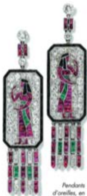
Pendants d'oreilles, en rubis, émeraudes, diamants, platine, vers 1925, signés Lacloche frères Paris. Collection privée.