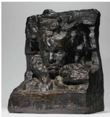
Antoine Bourdelle, Beethoven à deux mains , 1908, bronze, hauteur : 53,3 cm.