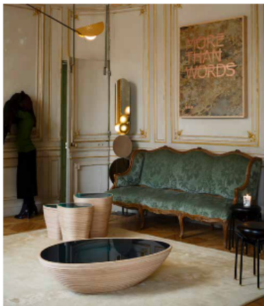
Vue de Private Choice 2020.