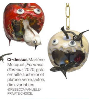
Ci-dessus Marlène Mocquet, Pommes d'amour , 2020, grès émaillé, lustre or et platine, verre, laiton, dim. variables @REBECCA FANUELE/PRIVATE CHOICE.